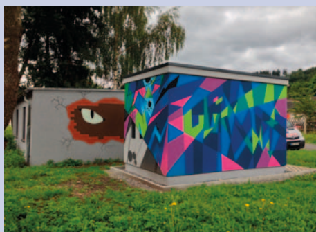
Kunstprojekt mit dem Gymnasium Olbernhau an der Trafostation am Pennymarkt

Neben Wartung und Erneuerung für einen störungsfreien Betrieb wird derzeit die gesetzlich vorgeschriebene Umrüstung auf digitale Stromzähler für alle Verbraucher vorangebracht.