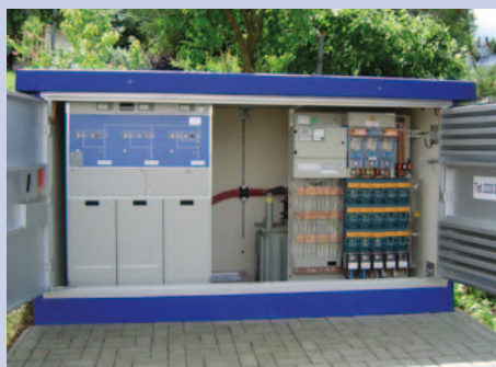
Ein Blick ins Innere einer modernen Trafostation.