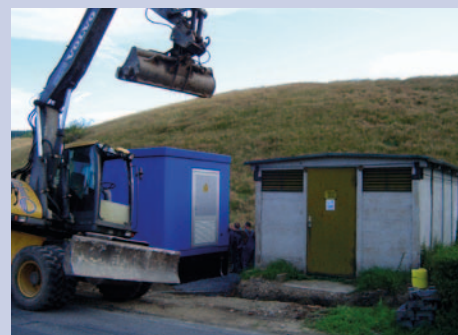
Die alten Trafostationen wurden wie hier in Hirschberg durch neue ersetzt oder saniert.